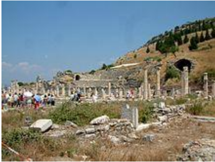
Efesus di Asia Kecil, tempat kelahiran Herakleitos

Herakleitos diketahui berasal dari Efesus di Asia Kecil . [1] Ia hidup di sekitar abad ke-5 SM (sekitar 540-480 SM). [3][4][7] Keterangan Diogenes Laertius juga menyebutkan Herakleitos lahir sekitar 540 sebelum masehi pada keluarga aristokrat di Efesus, namun nantinya meninggalkan kehidupan politik dan mengabdikan hak kekuasaan yang diwariskan padanya ke saudara lelakinya. [8] Herakleitos hidup sezaman dengan Pythagoras dan Xenophanes, namun ia berusia lebih muda daripada keduanya. [1] Akan tetapi, Herakleitos lebih tua usianya dari Parmenides sebab ia dikritik oleh filsuf tersebut. [1]